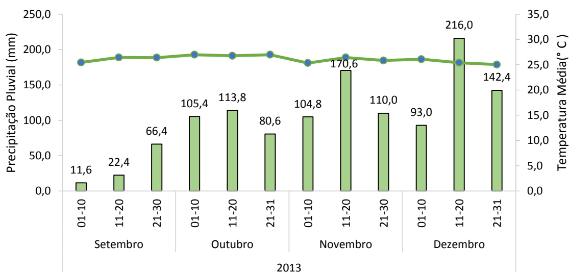
Figura 1. Precipitação pluvial e temperatura média nos decêndios compreendidos entre os meses de Setembro a Dezembro de 2013, com o acumulado de 1.237,0 mm no período. Fundação Rio Verde, 2014.

Nesta última safra agrícola, observou-se boa distribuição de chuvas nos decêndios compreendidos entre os meses de setembro e dezembro de 2013 (Figura 1). O volume acumulado no segundo decêndio de dezembro deste ano foi elevado, entretanto, em virtude da boa distribuição ao longo deste período não ocasionou maiores problemas no manejo das culturas no campo.