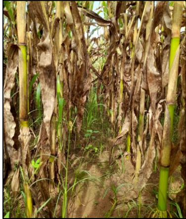
Herbitrin 500 BR